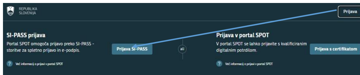
Slika 1: Prijava v sistem

Pred izpolnjevanjem obrazca se prijavite v portal SPOT, na naslovu – https://spot.gov.si/ .