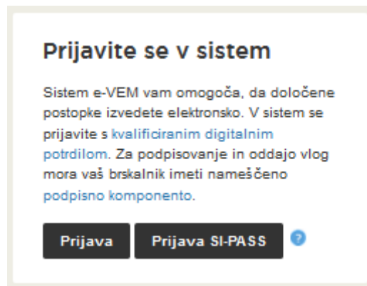
Slika 1: Prijava v sistem

Pred pričetkom izpolnjevanja vloge se je najprej potrebno prijaviti v portal e-VEM na tem naslovu – http://evem.gov.si/evem/drzavljani/zacetna.evem .