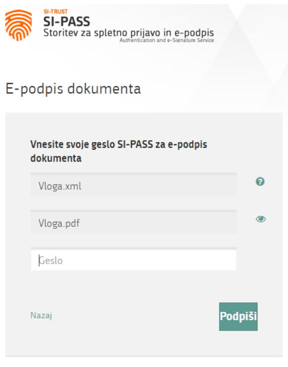
Slika 8: Podpis v SI-PASS

S klikom na gumb »Podpiši« portal uporabnika preusmeri na »SI-PASS«, ki omogoča oblačno podpisovanje. Z vnosom SI-PASS gesla podpišete vlogo.