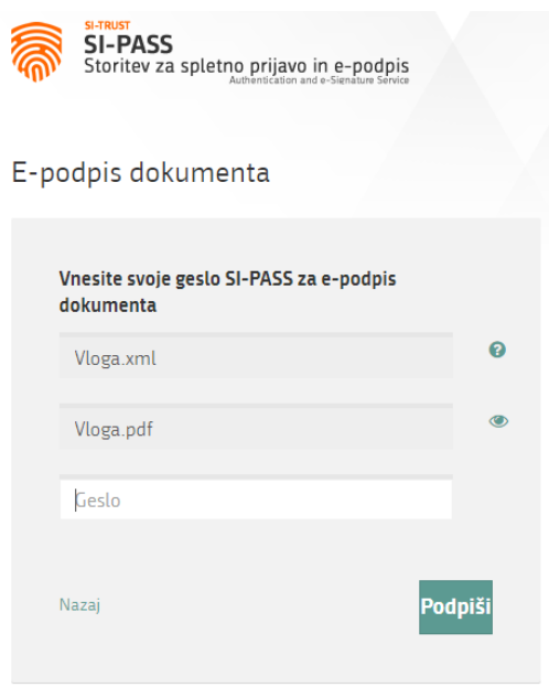
Figure 14: Signing in SiPASS

By clicking on the "Podpiši" [Sign] button, the portal redirects the user to "SiPASS", which allows cloud-based signing. By entering the SiPASS password, you sign the application.