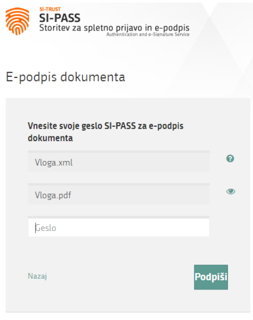
Slika 9: Podpis v SI-PASS

S klikom na gumb »Podpiši« portal uporabnika preusmeri na »SI-PASS«, ki omogoča oblačno podpisovanje. Z vnosom SI-PASS gesla podpišete vlogo.