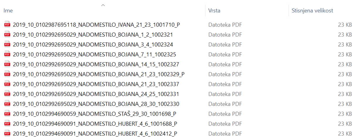
Slika 11: Primer vsebine stisnjene mape

Primer vsebine stisnjene mape je prikazan na sliki 11.