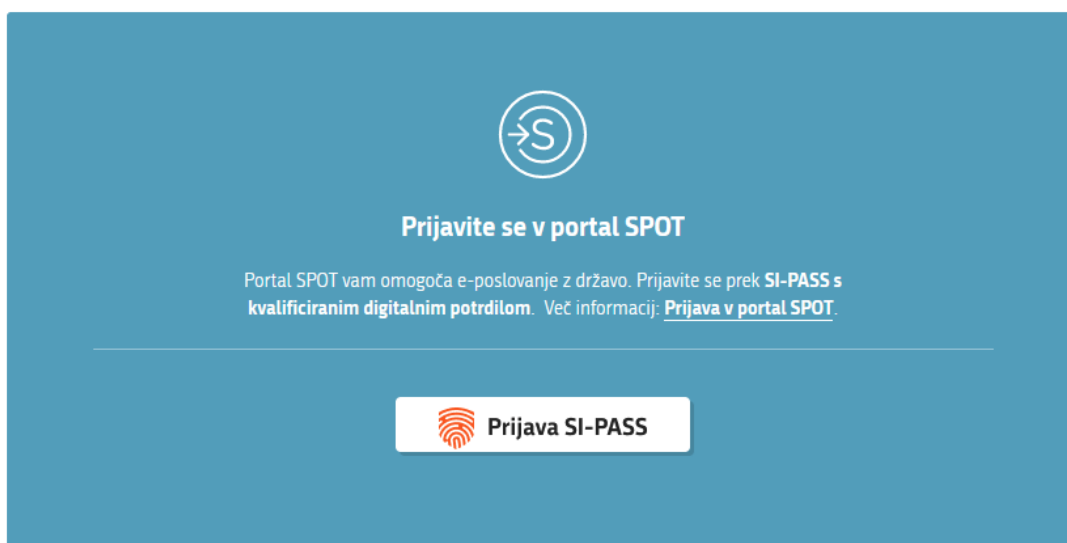
Slika 1: Prijava v portal SPOT

Prijava je mogoča prek » Prijava SI-PASS «.