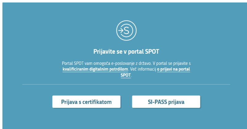
Slika 1: Prijava v portal

Na portal SPOT se podjetnik prijavi s svojim geslom, ki ga določi za uporabo SPOT sistema. Po prijavi vpiše svojo davčno številko.